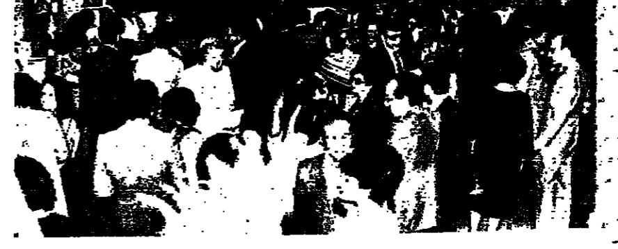
جانب من الاحتفال بمناسبة لختام الندوة